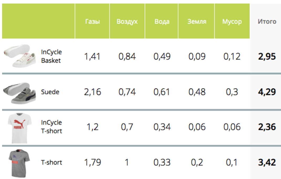
Таблица 1. Ущерб окружающей среде, наносимый отдельными вещами фирмы Puma € за футболку/пару обуви

А если посчитать всю цепочку ущерба по данным компании Puma, исходя из стоимости ущерба для 1 пары обуви в 4,29 €, то окружающая среда только от этой отрасли ежегодно несет ущерб в 62–90 млрд евро ($80–116 млрд) – диапазон от ВВП Омана до двух ВВП Белоруссии.