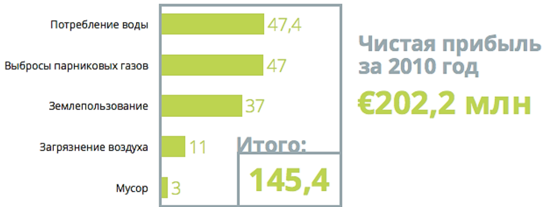
Рисунок 1. Ущерб окружающей среде, нанесенный продукцией фирмы Puma 2010, млн евро

Если бы эта цифра включалась в официальную бухгалтерскую отчетность как расход, то чистая прибыль компании сократилась бы почти вчетверо – с 202,2 млн евро до 56,8 млн евро.