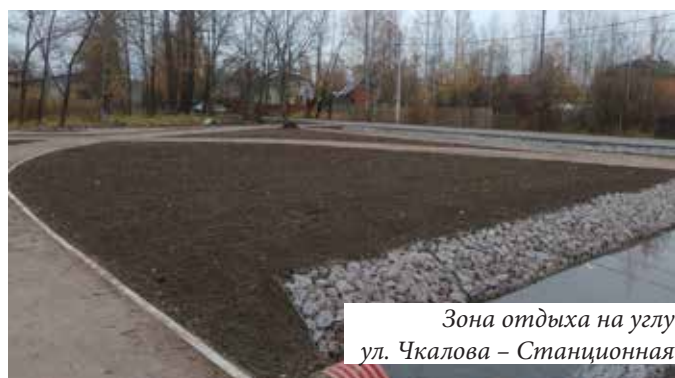
Зона отдыха на углу ул. Чкалова – Станционная