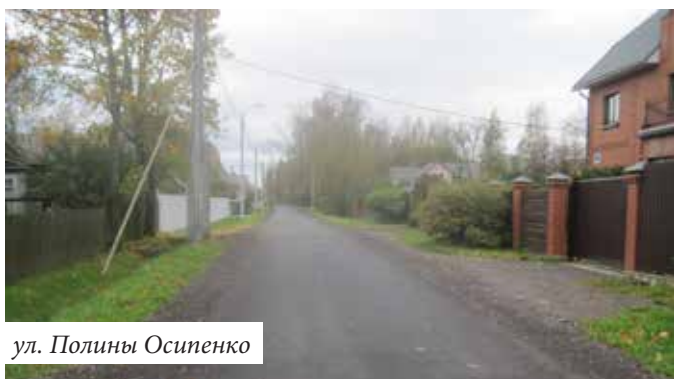
ул. Полины Осипенко