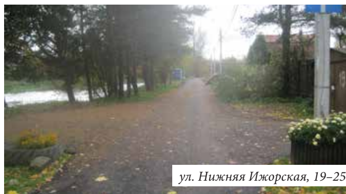
ул. Нижняя Ижорская, 19-25