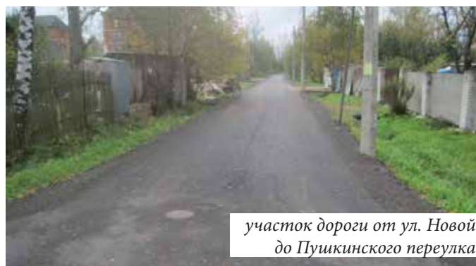
участок дороги от ул. Новой до Пушкинского переулка